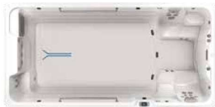
R500 (457 L x 226 P x 127 H cm)