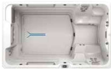
R200 (366 L x 226 P x 127 H cm)